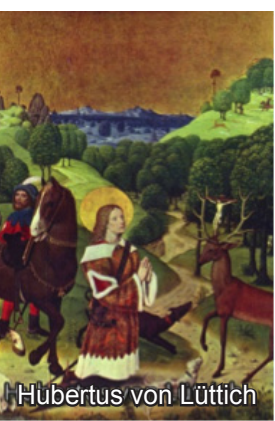
Hubertus von Lüttich